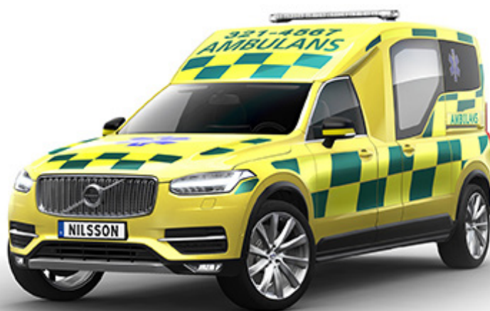
Illustration av nästa generation ambulans, baserad på Volvo XC90.

Läs fler artiklar på www.prodaktionslyftet.se .